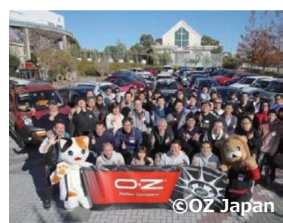
両社協力のもと開催した 【OZ Club Meeting 2017】